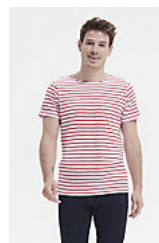
SOL'S MILES MEN 01398