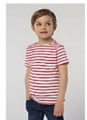
SOL'S MILES KIDS 01400